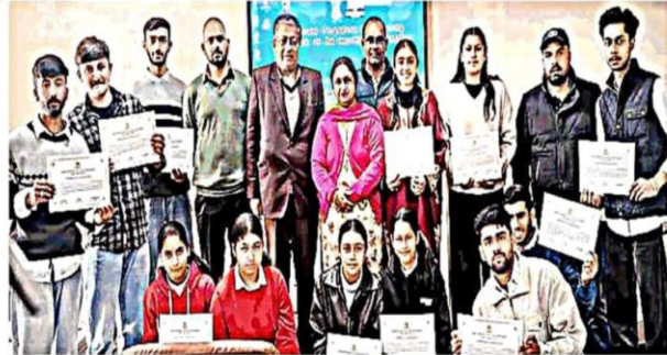
शिमला : चायल कोटी कॉलेज में सांख्यिकी जागरूकता कार्यक्रम की विभिन्न प्रतियोगिताओं के विजेता छात्र मुख्यातिथि के साथ संयुक्त चित्र में।